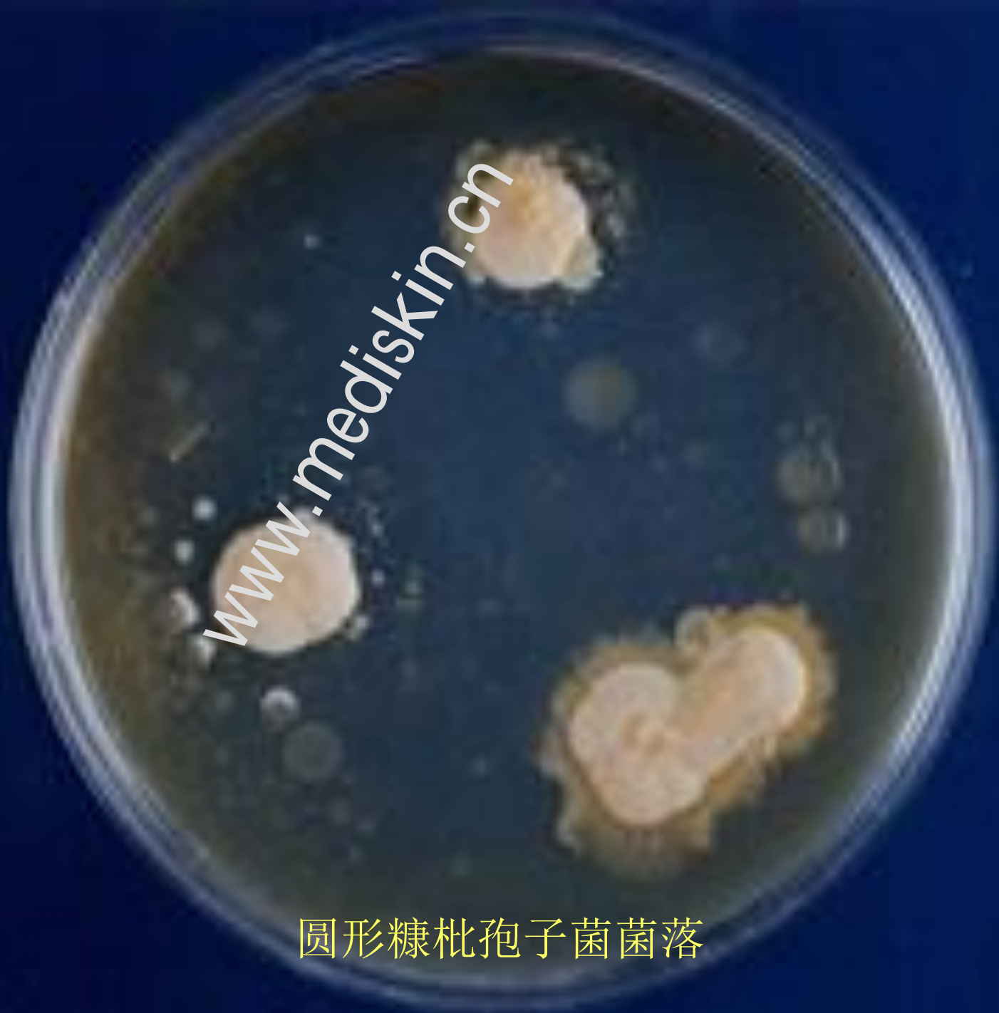
圆形糠秕孢子菌菌落